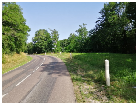
Engazonnement du délaissé, virage des acacias