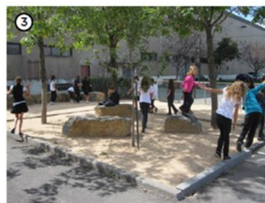
Zone en stabilisé ombragée