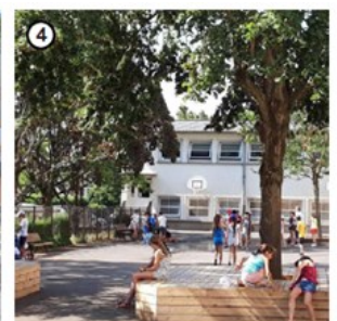
Mobiliers sur mesure en bois permettant des assises et une protection d'arbres existants