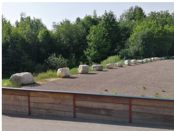
Rochers parking SMA