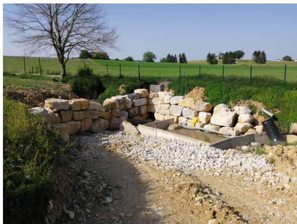
Enrochement, dessableur et sécurisation de la faille à la STEP de Pouligney