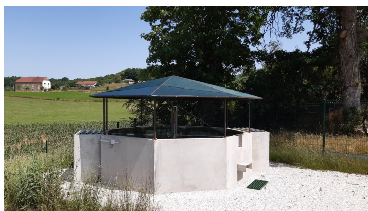
Filet à gland STEP de Lusans