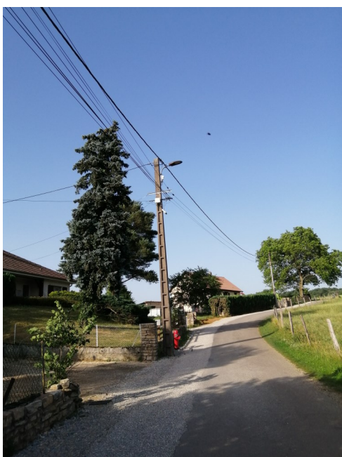
Finissions travaux sur les conduites d'eau rue de la Chaille