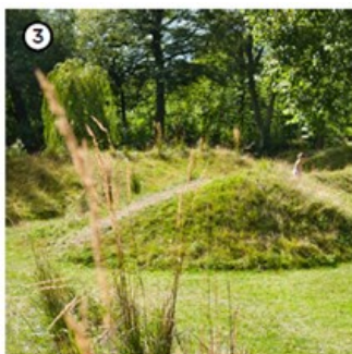
Modèles de terre dans la prairie permettant de ne pas exporter les déblais et apporter du volume