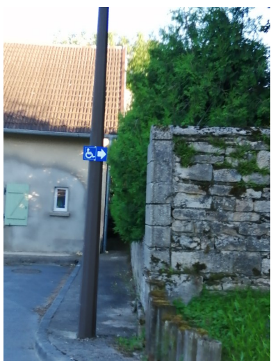
Signalisation accès handicapé cantine-église