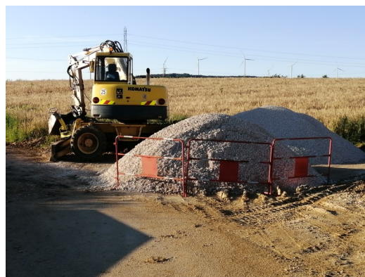
Travaux d'assainissement rue de la Pérousotte