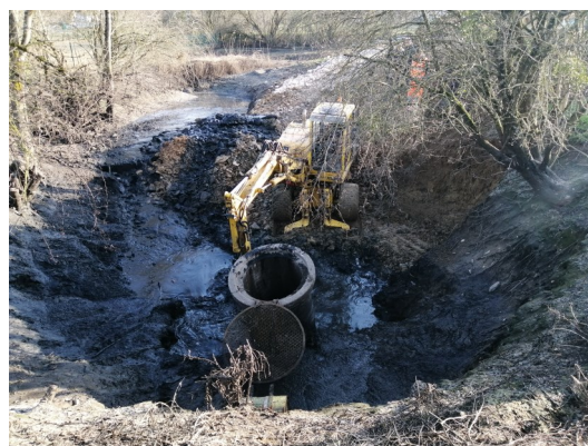
Curage de la faille de la STEP de Pouligny