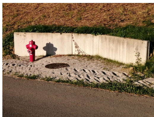
Poteau incendie chemin des Essarts