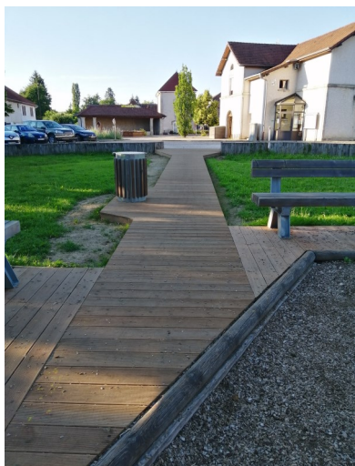
Accès au parc à jeux