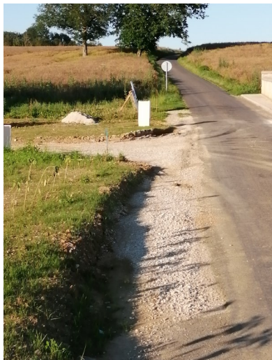
Extension du réseau électrique rue de Vennans