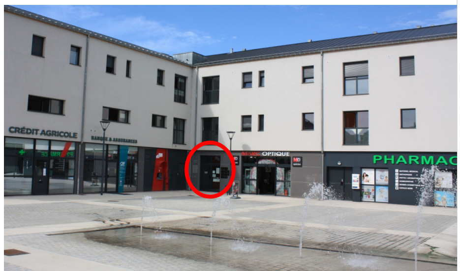
CCDB - 12 Esplanade du Breuil - BAUME LES DAMES