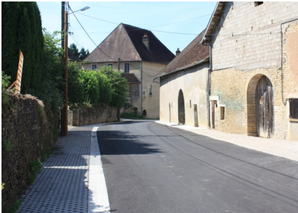
Réfection de la chaussée et des trottoirs Chemin du Château