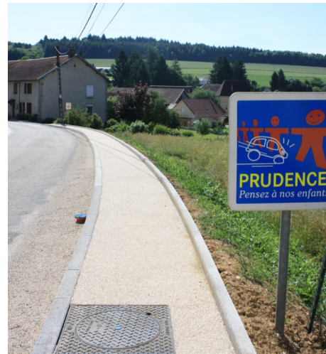
Entrée de Lusans, côté Corcelles Trottoirs et bords de route.