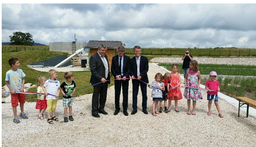
INAUGURATION DE LA STATION D'ÉPURATION SAMEDI 25 JUIN