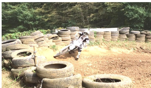
ANIMATION DU MOTO-CLUB DIMANCHE 28 AOÛT