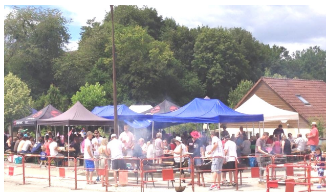
PIQUE-NIQUE DE L'ELAN DIMANCHE 3 JUILLET