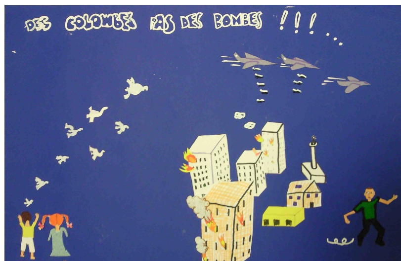
Affiche sélectionnée par le jury départemental et par le conseil municipal de Besançon