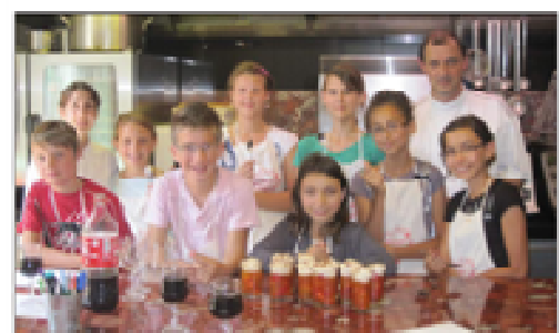
■ Les jeunes apprentis pâtisseries ont pu déguster leurs réalisations à la fin de l'activité.

Deluz La cuisine gastronomique se savoure avec les Francas