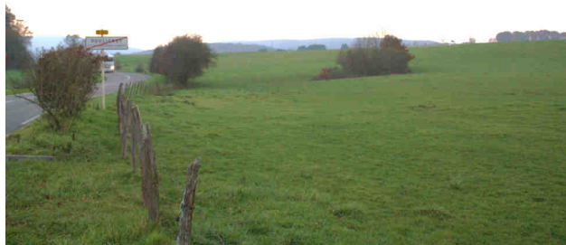
Emplacement de la future station d'épuration

choisi de la positionner en forêt sur un terrain communal, à gauche en partant sur Chaudefontaine. La police de l'eau a refusé précisant que le terrain forestier présente un caractère humide de par les caractéristiques pédologiques observées, ainsi que le cortège floristique et les habitats qu'il définit. Le conseil municipal a reporté le choix de l'emplacement sur des terres cultivables à droite en partant sur Chaudefontaine.