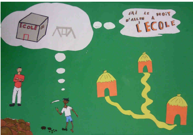
Affiches sélectionnées par le jury départemental

Durant ces 6 vendredis après midi, la classe ressemblait à une vraie ruche ou chacun s'activait et prenait du plaisir aux tâches qui lui incombait.