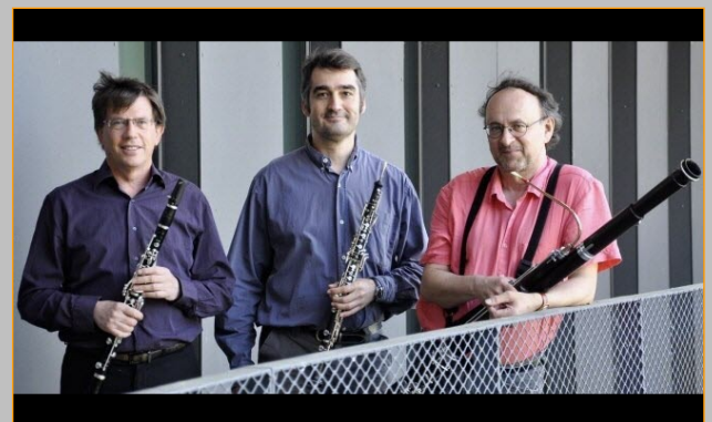
Trio d'anches